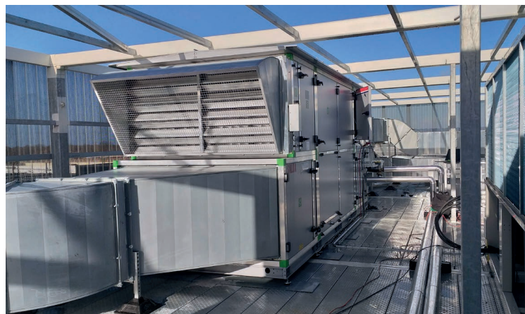
CTA Air Hygiénique des Bureaux 14 950 m 3 /h