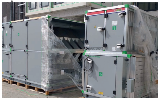
CTA Bureaux au sol avant assemblage des éléments.