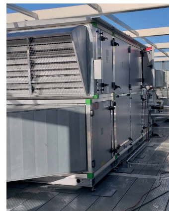
CTA Compacte Espace Conférence 3000 m 3 /h